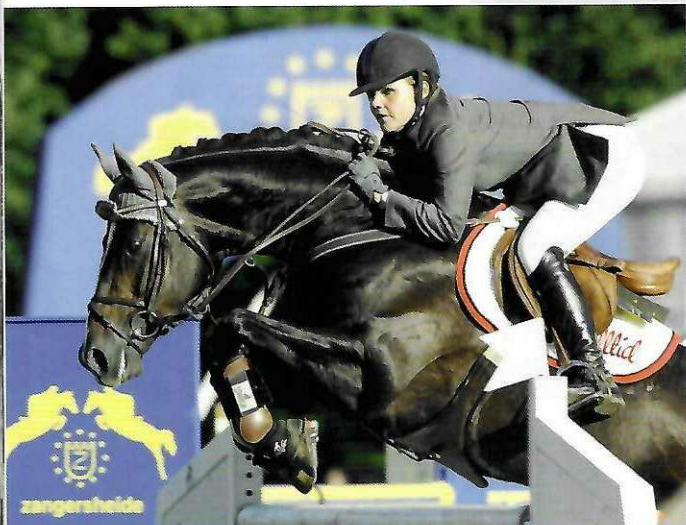
UNTEN | Favoritas xx war ein Held im internationalen Parcour und wurde leider nicht genügend erkannt.